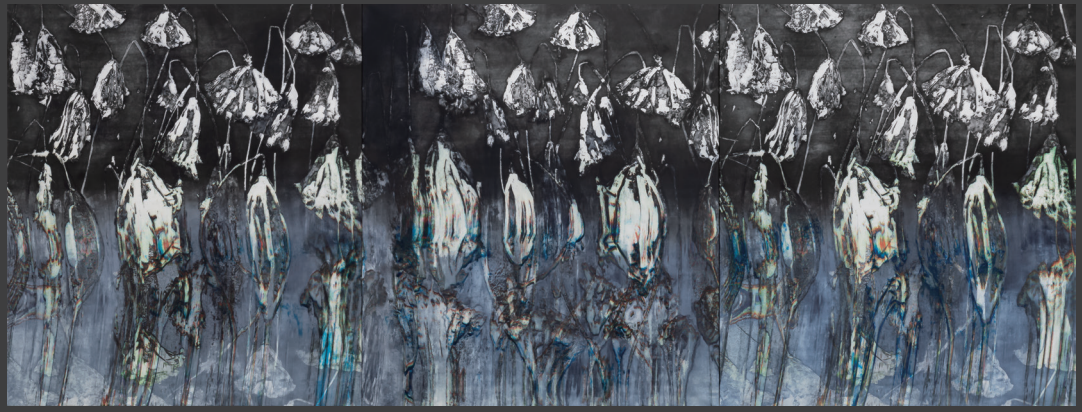
武雄文子 | Spectacular pond | 2024年

映像作家。自然や日本の文化をモチーフに、鑑賞者が自然と向き合ったときの感覚を呼び起こす「自然の再現」をテーマに作品を制作しています。 2001年尼崎市生まれ。2026年京都精華大学大学院芸術研究科映像領域入学。主な展覧会に、グループ展「cycle」（京都精華大学ギャラリーTerra-s／京都、2025）、二人展「node」（kara-S／京都、2024）。