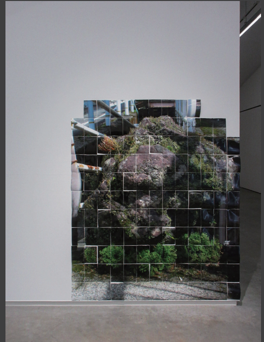
筒井夏鈴 | Patina | 2025年