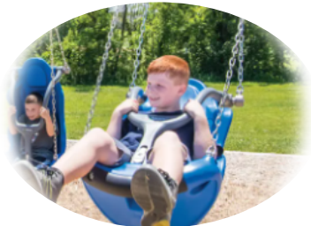
インクルーシブブランコ

身体のバランスや握力が弱い子どもでも安心して使える設計のブランコで、だれもが楽しく遊べます。