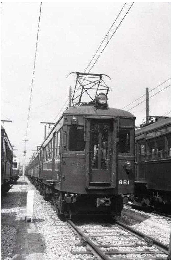
阪神時代、6両編成の先頭に立つ881形881号車 尼崎車庫 昭和40年3月