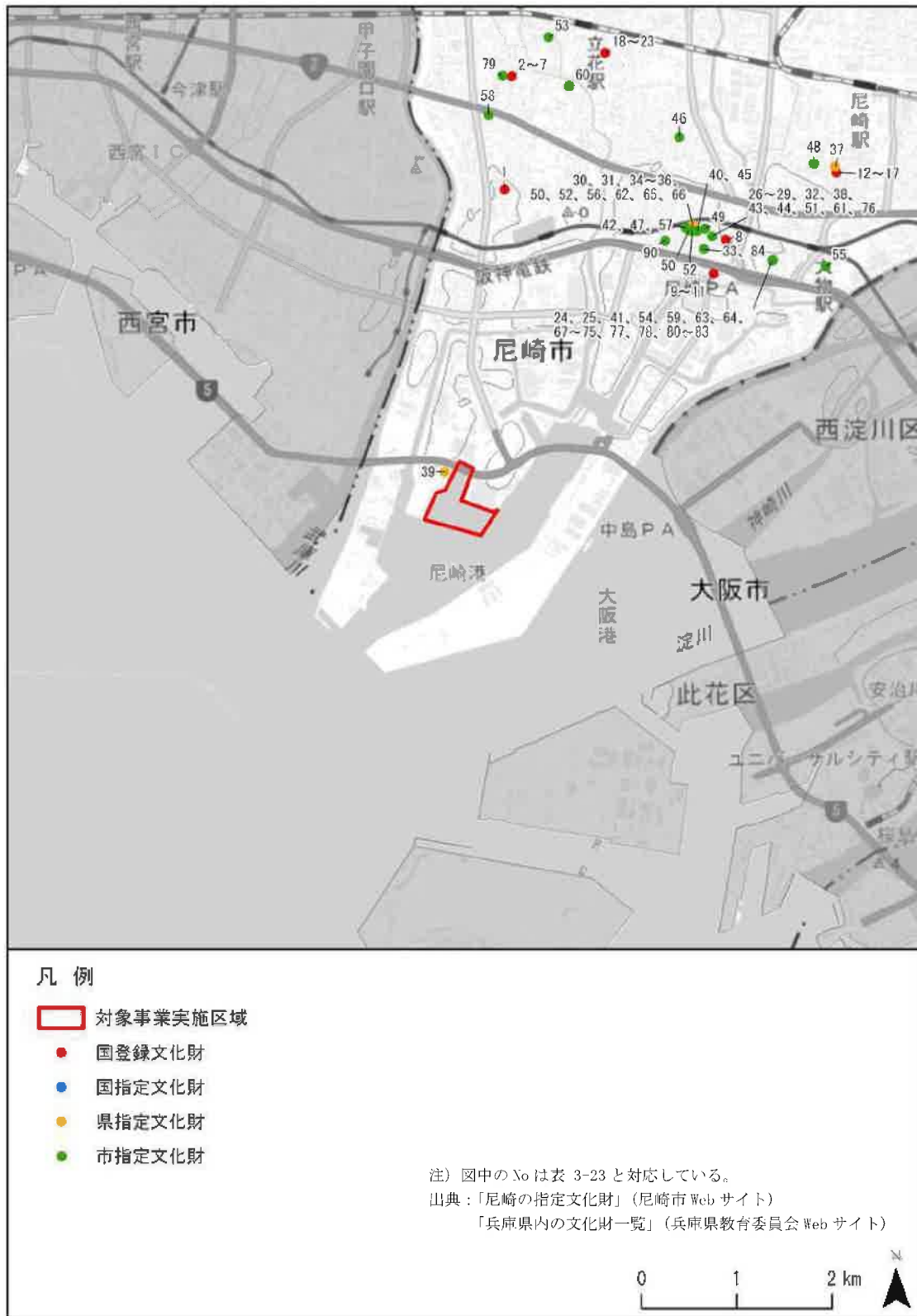
図 3-10 調査対象区域の文化財位置図