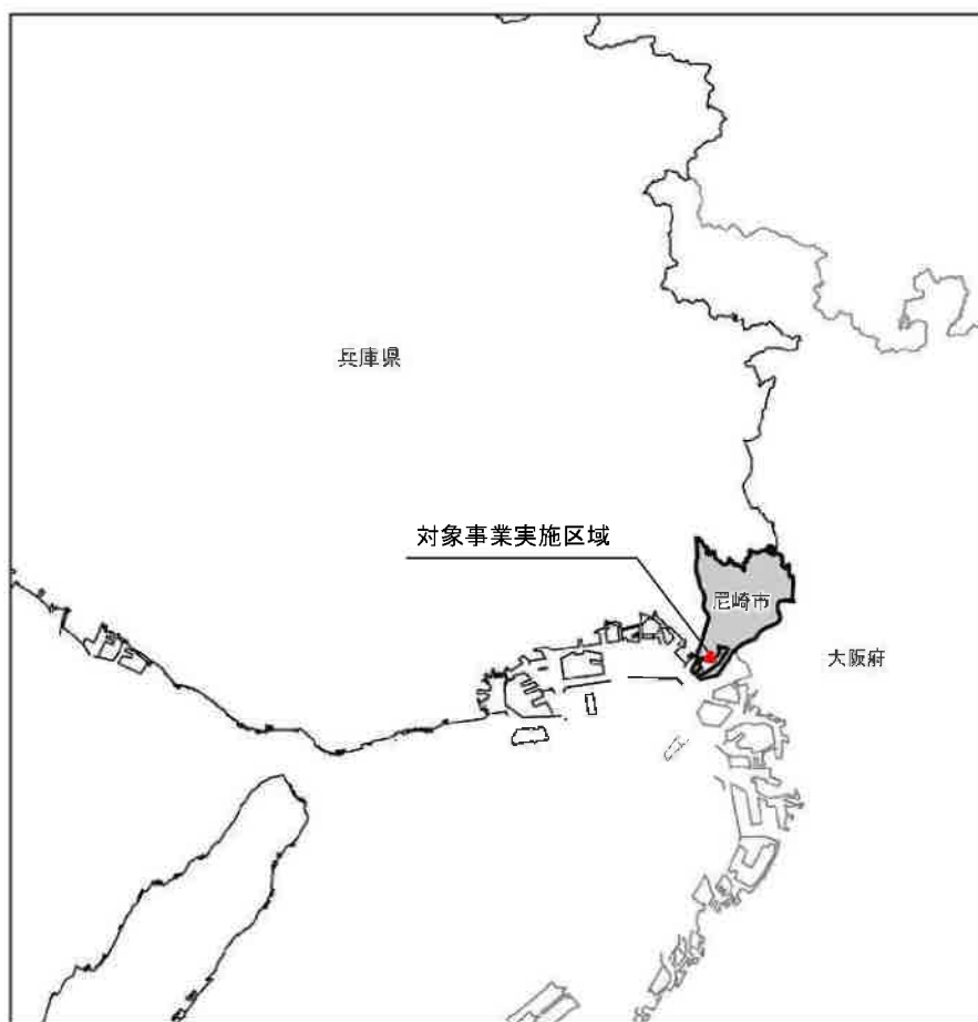
図 3-1 対象事業実施区域の周辺地域

周辺地域の概況は、「3.1 社会の概況」、「3.2 自然の概況」、「3.3 環境の概況」にそれぞれ示すとおりである。