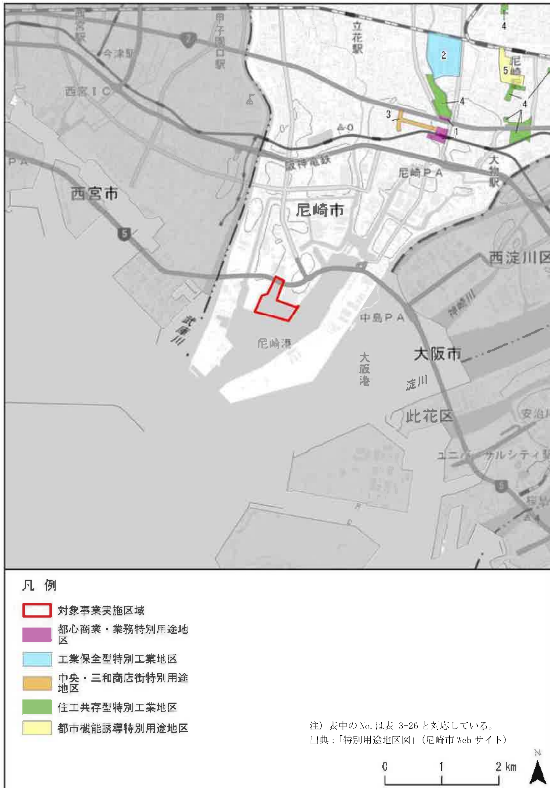
図 3-13 調査対象区域の特別用途地区