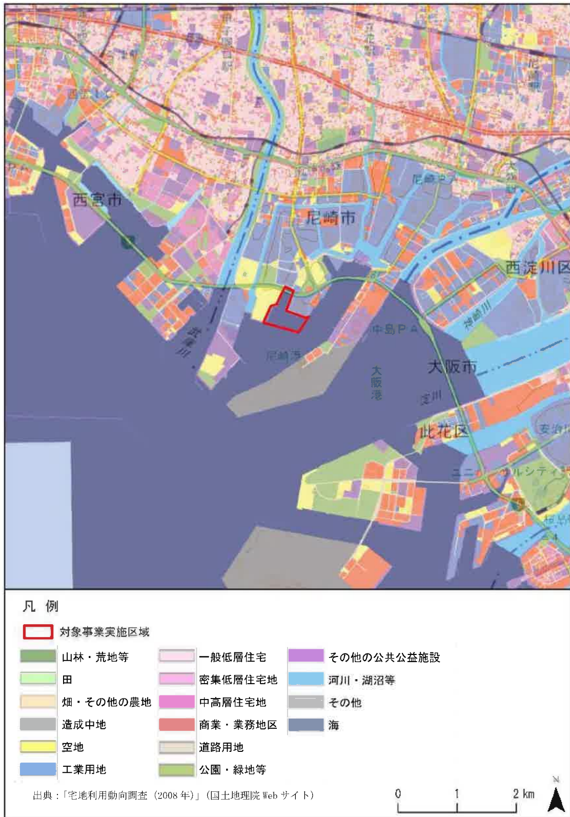
図 3-3 調査対象区域の土地利用現況図