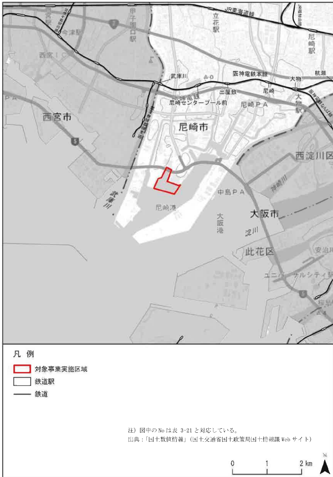
図 3-8 調査対象区域の鉄道網図