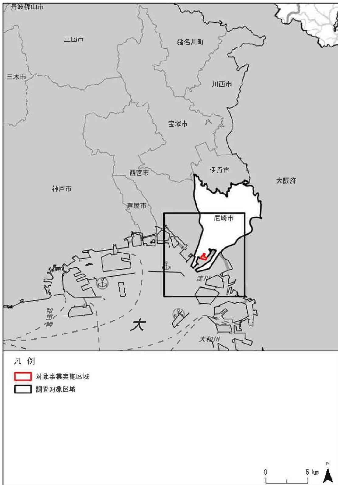
図 3-2 地域概況の調査範囲