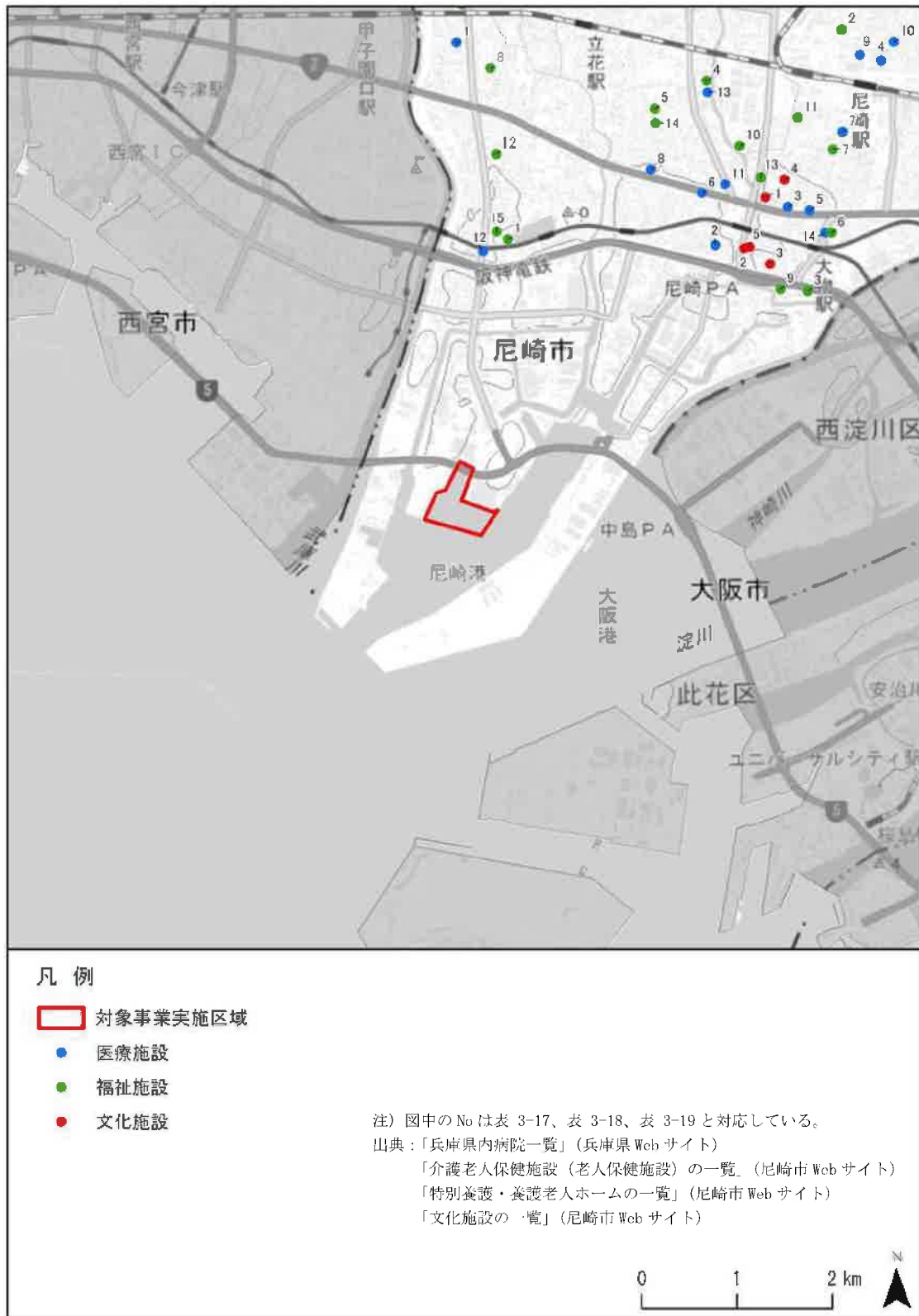
図 3-6 調査対象区域の医療施設、福祉施設及び文化施設の配置状況