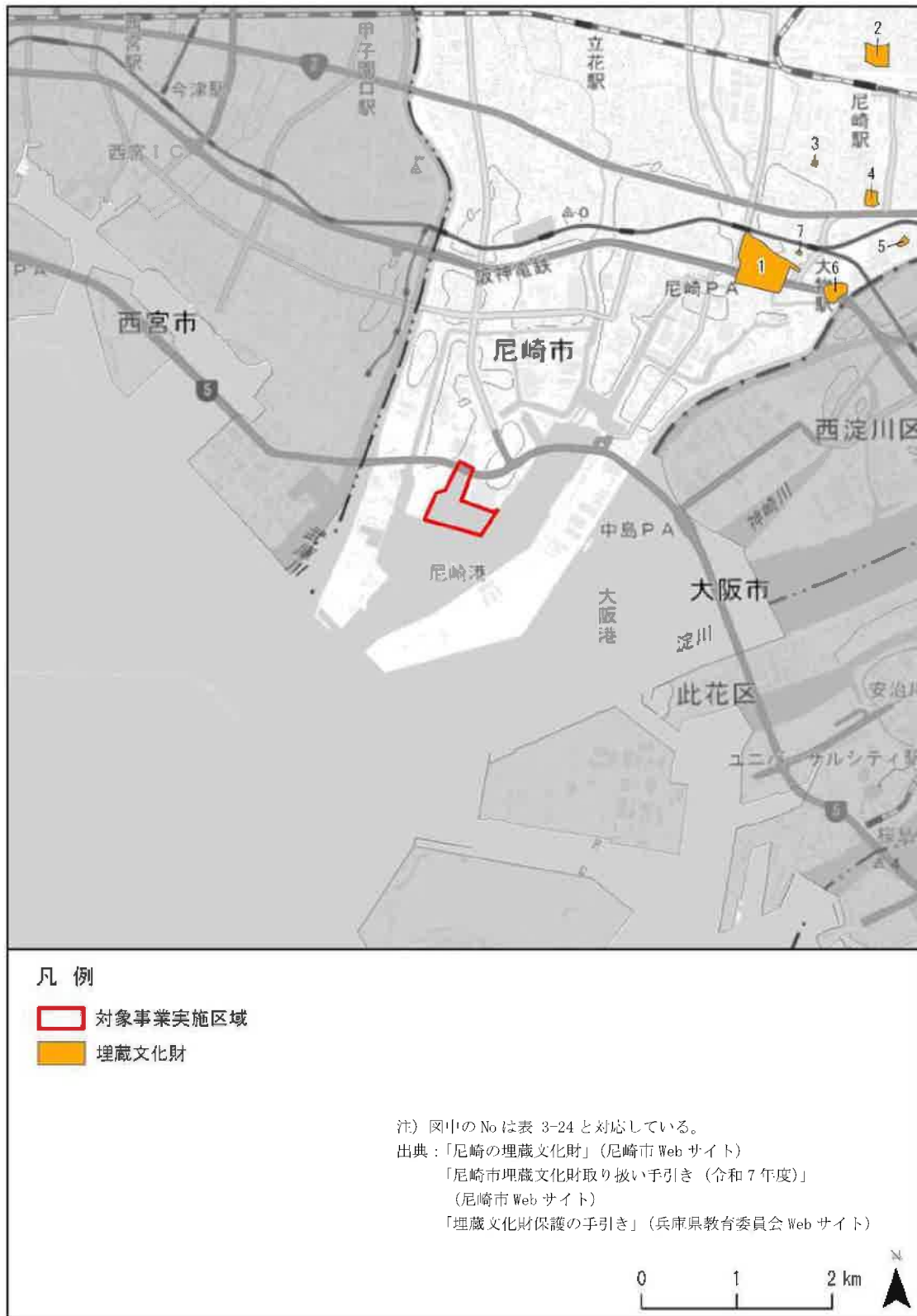
図 3-11 調査対象区域の埋蔵文化財位置図