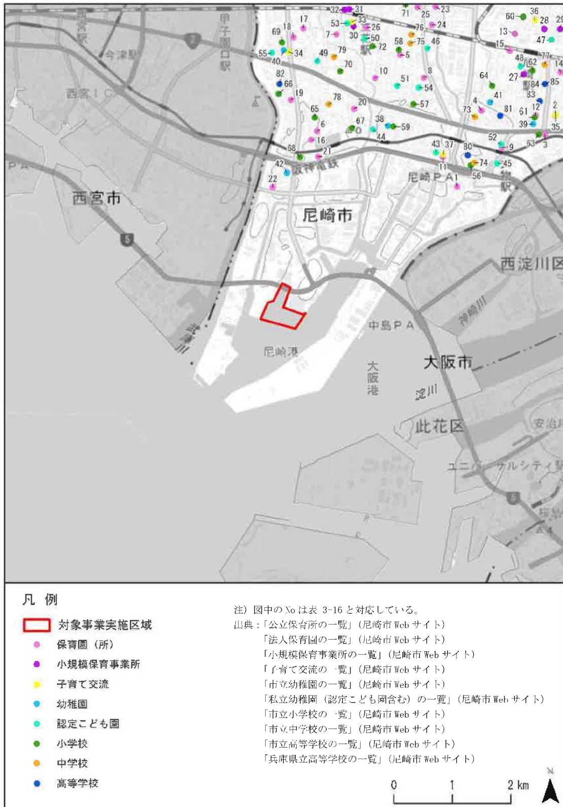
図 3-5 調査対象区域の学校などの配置状況