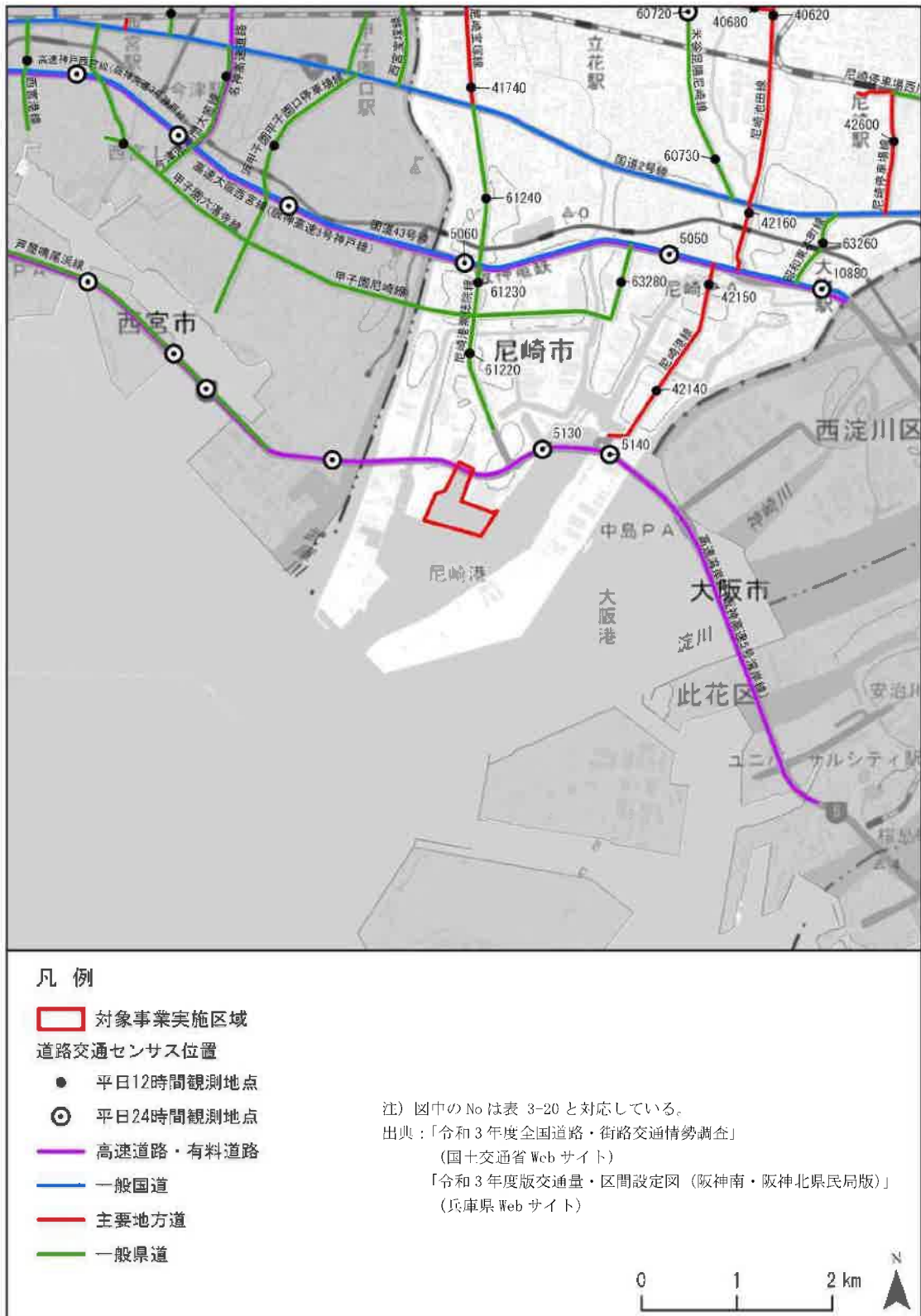
図 3-7 調査対象区域の主要な道路網と交通量センサ位置