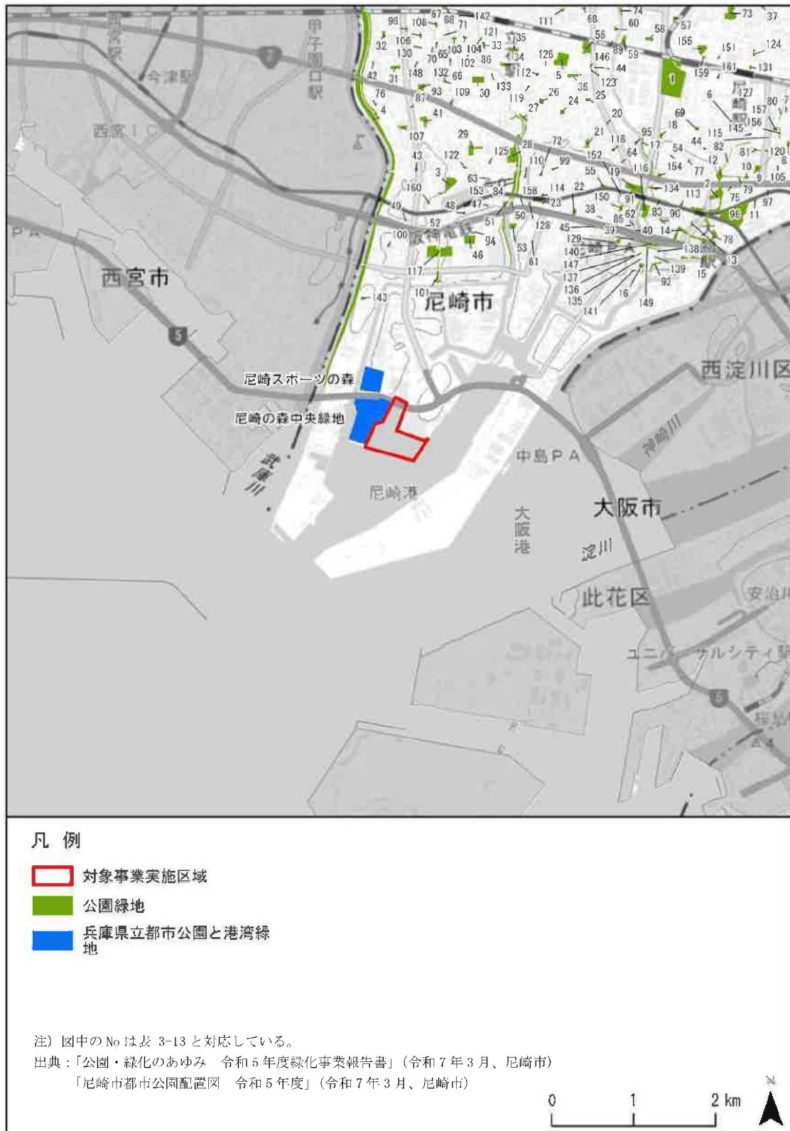
図 3-4 調査対象区域の公園、緑地の分布状況