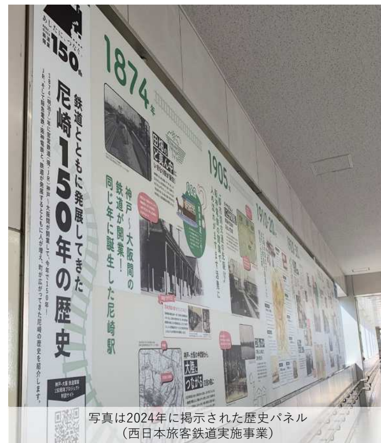
写真は2024年に掲示された歴史パネル （西日本旅客鉄道実施事業）