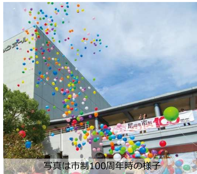
写真は市制100周年時の様子