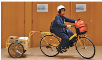
物資の運搬などに利用

また、災害や避難に対する不安を少しでも解消できるように、同プラザ内の実際の設備や備蓄品を見学したり、武庫荘総合高校のボランティアグループ「チャリズム」の皆さんが廃棄予定だった自転車を利用して製作した防災自転車の試乗を実施したりしました。最後に防災士の方からの講話もあり、参加者からは「普段見ることができないプラザの設備や備蓄を見ることができてよかった」「何が必要で、どんな準備をすればいいかイメージすることができた」などの声がありました。