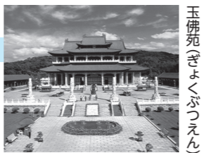
玉佛苑ぎょくぶつえん

円) 日 4月25日(必着)までに専用フォームか所定の用紙を郵送かEメールで市役所南館2階政策秘書担当。選考(面接)は5月10日(土)。選考後、派遣までの間に研修(土曜日午前中計4回)を受講する必要があります。