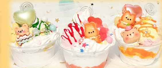
デコパフェづくり