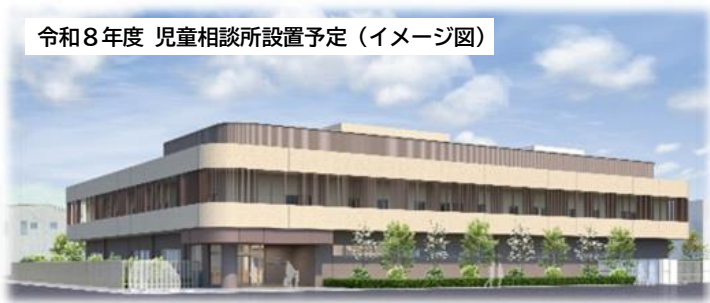
令和8年度 児童相談所設置予定（イメージ図）

https://secure.bsmrt.biz/amagasaki-city/j/Job.php