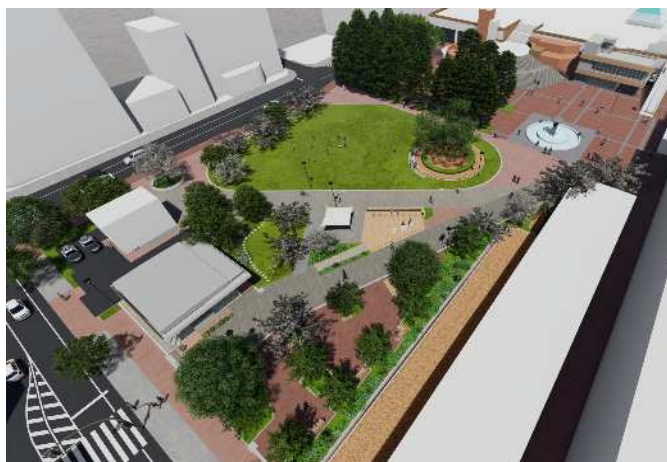
阪神尼崎駅前（中央公園）へ設置する「うわさ」のイメージ図（上）とパース図（下）