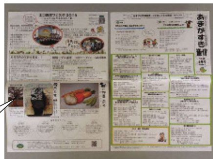
NPO 法人が発行している環境情報誌