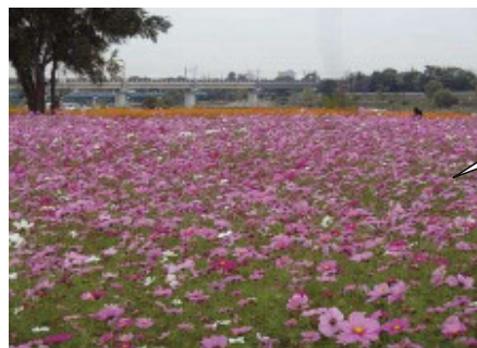
多くの人の目を楽しませるコスモス園 (武庫川河川敷)