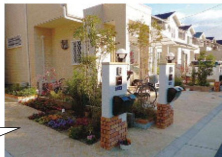
住宅地における緑づくり (市内)