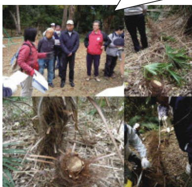
ボランティアによる佐璞丘の保全活動の様子