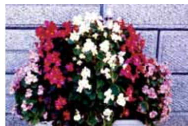
市の草花「ベゴニア」

「市の木・市の花・市の草花」のシンボルマークは、市域を丸く表現し、「市の木・市の花・市の草花」が、市域の各所に見られ、「尼崎のまちが花と緑であふれるようにしていこう」ということをイメージしています。