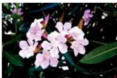
市の花「キョウチクトウ」