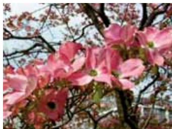
市の木「ハナミズキ」

市の花「キョウチクトウ」(昭和27年(1952年)4月8日制定)に加えて、平成3年(1991年)3月の尼崎市公園緑地審議会からの答申により、尼崎市「市の木・市の花」選定委員会を設置し、市民アンケートの結果などをもとに、緑化活動のシンボルとして、また、尼崎市の新しいイメージづくりにと、市の木「ハナミズキ」、市の草花「ベゴニア」を平成5年(1993年)1月18日に追加指定しました。