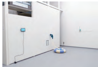
土屋咲瑛 (ルームフルアールズ (スルー・ユウ)) 2024

展覧会 | 「ETUDE」(京都芸術大学NC棟 / 京都) 2022、「京都芸術大学卒業展 / 大学院修了展」(京都芸術大学NC棟 / 京都) 2024、「Explore Kyoto vol2」(宝ヶ池公園 / 京都) 2024 受賞 | 「京都芸術大学卒業展 / 大学院修了展」奨励賞 (2024)