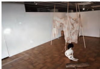
笹崎凜 (日常と非日常) 2024

展覧会 | 「大脳切片」(京都市立芸術大学ギャラリー / 京都) 2021、「絵画の鉢植え」(ギャラリー35 / 京都) 2022、「権-kai-」(京都市立芸術大学日本画 川崎渉研究室 修了生展 / ギャラリーCreate 洛 / 京都) 2022