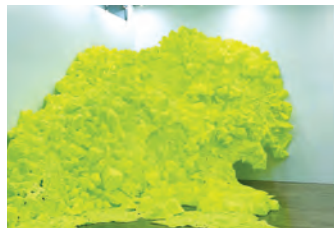
白井桜子 (dune) 2024

展覧会 | 「SCOSWAPAN」(Gallery Heptagon / 京都) 2023、「侵色:開始」(京都精華大学ギャラリー Terra-S / 京都) 2023、「Saturday Night Once More」(WALL_alternative / 東京) 2024