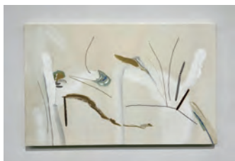
藤村明日香 (蝶穴) 2024

展覧会 | 「第44回日本新工芸展第5回学生選抜展」(国立新美術館 / 東京) 2022、「JAPANTEX2023 NIF YOUNG TEXTILE」(東京ビッグサイト / 東京) 2023、「2023年度京都芸術大学 卒業展 / 大学院 修了展」(京都芸術大学 / 京都) 2024 受賞 | 「第59回兵庫県展」特席[県展大賞]、一席[部門大賞] (2022)