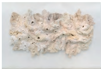
丹生あさ (Coral bleaching) 2023

展覧会 | 「シェル美術賞展2021」(国立新美術館 / 東京) 2021、「京都市立芸術大学作品展2023」(京都市立芸術大学 / 京都) 2024、「アートアワードトーキョー丸の内2024」(行幸地下ギャラリー / 東京) 2024 受賞 | 「シェル美術賞2021」入選 (2021)