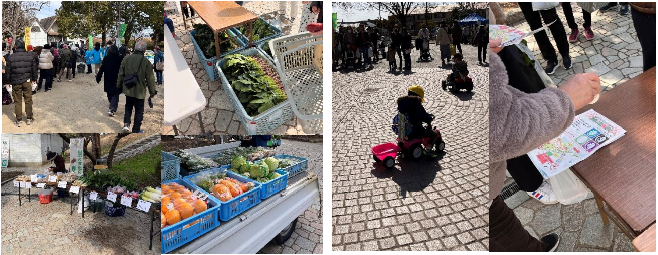
令和4年度尼崎市農業公園梅まつりの様子

農業公園駐車場（22台収容）が満車時には、臨時駐車場として設けた園田競馬場第3駐車場（椎堂2丁目1）へ案内し、農業公園と園田競馬場第3駐車場間をマイクロバスでピストン輸送することにより来園者を農業公園まで送迎します。