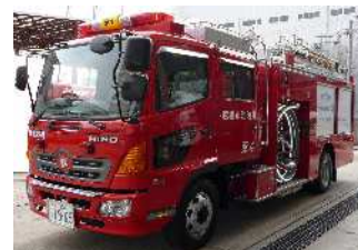
《化学消防ポンプ自動車》