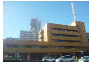
《尼崎市防災センター》