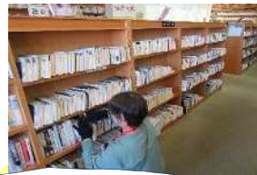
点検中はボランティアさんにもご協力をいただきました。

12月4日(月)から14日(木)の間、館内の書架にある本のバーコードを一冊一冊読み取って、蔵書点検を行ったほか、新聞の地方版を永久保存するための作業を行いました。また、今回は一般室やこどもの本のへやの新しい表示作りや貼り替えを行い、YA紹介コーナーを階段の壁面に新設しました。X(旧Twitter)の「【公式】尼崎市立中央図書館」でも様子を紹介しています。