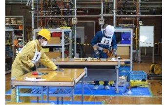
前年度開催の様子