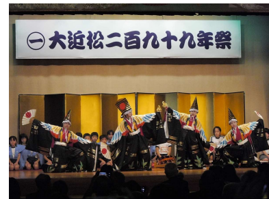
昨年度の大近松祭

令和5年は近松没後300回忌の節目となり、例年より催しを充実させた「大近松祭-三百年祭-」を開催します。ぜひ、当日の様子など御取材いただきますようお願い申し上げます。