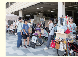
同マルシェの様子