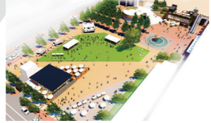
整備後完成イメージ

民間事業者と協働し、魅力ある駅前空間を目指して駅北側の中央公園西側部分をリニューアル