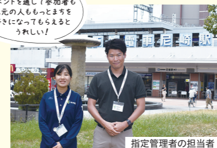
指定管理者の担当者