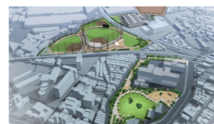
整備後完成イメージ

小田南公園に移転する阪神タイガースのファーム施設をはじめ、大物公園や大物川緑地など一帯を整備