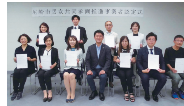
新規認定事業者の認定式で

今後も同事業者の取り組みを支援するとともに、男女共同参画について啓発していきます。