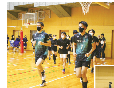
トップアスリートから直接指導を受けられます

市内在住か在学中でバレーボール経験がある中学生 30人 8月7日～25日に直接か電話、Eメール（住所、氏名、電話番号、性別、学校名、学年を書いて）でスポーツ推進課。