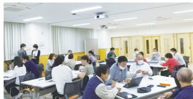
開催に向けて会議中

9月24日(日)午前10時～午後4時30分、園田競馬場で、園田カーニバルを開催します(☎1034543)。コロナ禍のため開催を見送ってきた同カーニバルですが、4年ぶりに開催することになりました！ 実行委員会の皆さんと会議を重ね、準備を進めています。今年のお祭りは特に「園田らしさを感じられるお祭りに」「多くの世代と交流できるようなお祭りに」という思いで、地域の団体などによるステージやバザー出店、農産物や消防団による防災体験など盛りだくさんの催しを考えています。今回から新たな取り組みとして、同カーニバルのホームページを作成しました。当日のプログラムや、出演団体の紹介を随時更新しますので、要チェック！