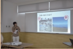
◇ 他拠点の運営紹介