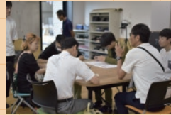
◇ チームごとに意見交換