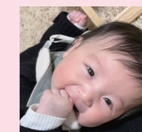
千湊ちゃん R04年10月生 せんちゃんだいすき! にいにより