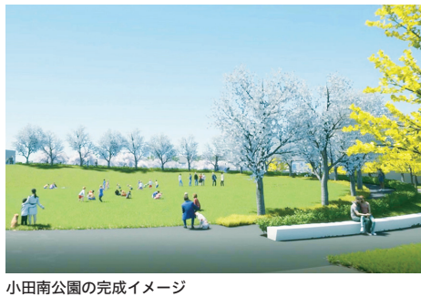
小田南公園の完成イメージ

辺の大物公園や大物川緑地などを含めた同先行地域全体で再現し、まち全体の魅力を高めていきます。小田南公園の工事の進捗状況などを発信するインスタグラムもぜひチェックしてください。 プロ野球のにぎわいと自然・憩いの場が共存する新たな小田南公園の完成はもちろん、大物公園や大物川緑地も含めて一体的に取り組む同整備計画にご注目ください！