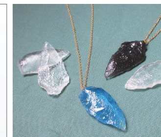
矢じり風ペンダント