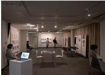
追手門学院大学社会学部社会文化デザインコース 卒業制作展2023 展示の様子