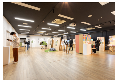
近畿大学文芸学部文化デザイン学科 卒業制作展2023 展示の様子