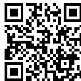
マイ避難カード作成支援動画

平時からハザードマップ等を確認し、自分自身の避難行動をあらかじめ確認し、書き記しておくことで、いざという時に速やかな避難行動に役立てることができます。