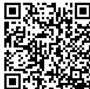
各種ハザードマップ (HP)