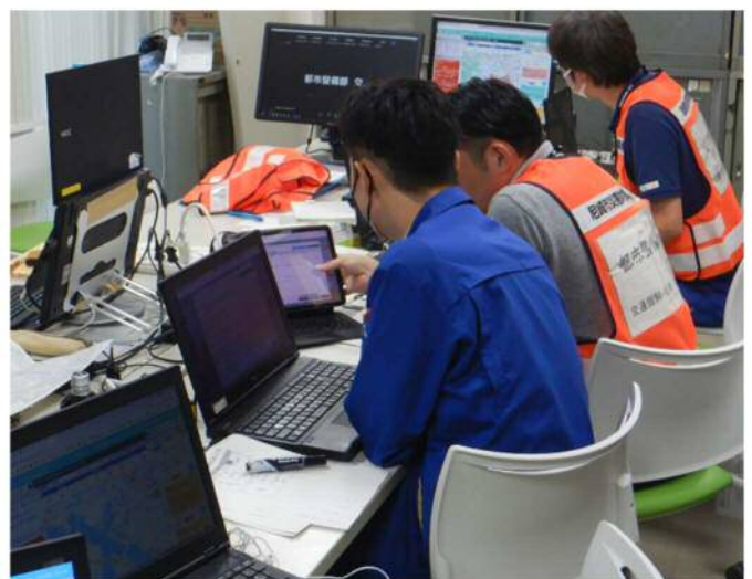
各部の訓練の様子