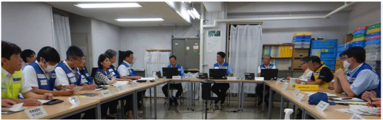
災害対策本部員会議の様子

※訓練参加者が地図などを活用し、想定された災害情報を基に議論しながら模擬的に災害時の対応を考える訓練