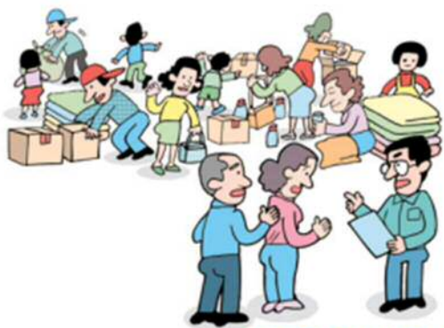
避難所生活を体験してみる

尼崎市は75の自主防災会があり、毎年多くの自主防災会で訓練や出前講座を行っています。