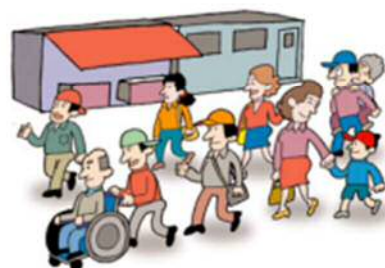
みんなで歩いて避難訓練