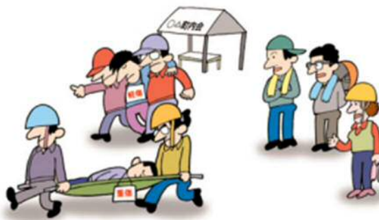
みんなで救護の手順を学ぶ