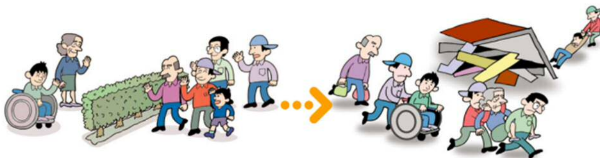
ふだんからお互いに声をかけあうと

また、お年寄りや障害のある方など災害に弱い方々の立場にたった心配りが大切になります。※このような方を「災害時要援護者」ということもあります