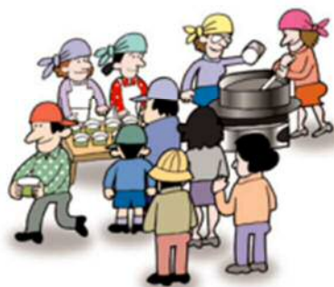
ご近所で炊き出しの訓練