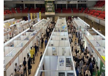
前年度開催の様子