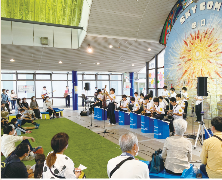
塚口さんさんタウンスカイコムを利用し開催されたジャズコンサートには中学・高校生が出演