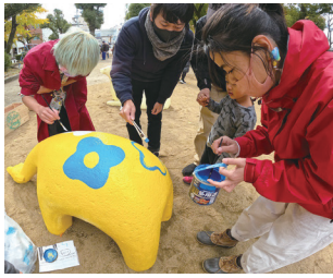
杭瀬公園では遊具を地域の人みんなでペイントするイベントが開催

まちづくりというと難しいかもしれませんが、例えばごみ拾いや花壇作り、イベントや祭り、防災訓練といった身近な活動もその一つです。本市では鉄道駅周辺を中心に、エリアごとの特色を捉えたまちづくりを多様な主体と連携しながら進めています。