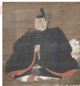
特別出品・佐々成政画像 (法園寺所蔵)

4月22日～9月3日 午前9時～午後5時 (最終入館は4時30分)、同館で、開館するまで30年以上を要した同館の開館までの歩みの紹介を。