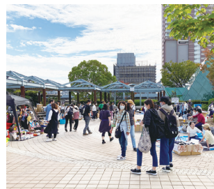
フリーマーケットでにぎわう中央公園

4月1日から、新たな指定管理者が中央公園を含む周辺の公共施設を一体的に管理しています。施設の維持管理にとどまらず、事業者のノウハウを生かしてイベントなどを主催しながら、阪神尼崎駅前ににぎわ