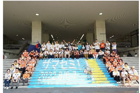
第8回開催時のスタッフの集合写真

この「学校ごっこ」を通じ尼崎市では、学びを活かし活躍できる場が身近にあり、それを「面白い！」と応援する人たちとの出会いを大切にしていきます。