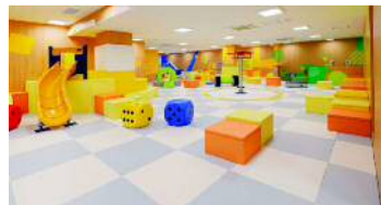
Moovi（モーヴィ）あまがさき