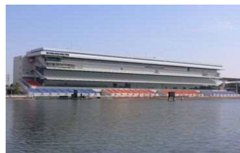
ボートレース尼崎 メインスタンド