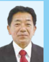
長洲西通 59歳・維・1回

6月26日まで。 写真の下は住所・12月1日現在の年齢・党派（維＝日本維新の会）・当選回数。住所・党派は立候補届け出時のものです。