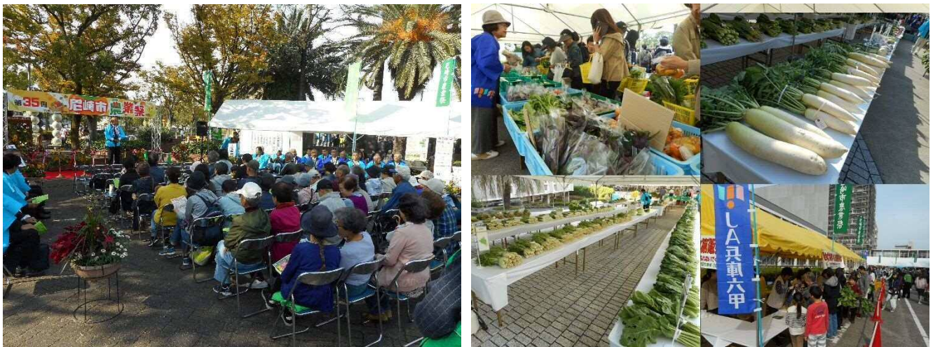
第35回（令和元年度）尼崎市農業祭の様子

また、飲食の提供や例年子どもに人気のイベントが行えない中、少しでも子ども達に楽しんでもらえるよう、ミニ新幹線やスタンプラリー等のイベントを予定しています。