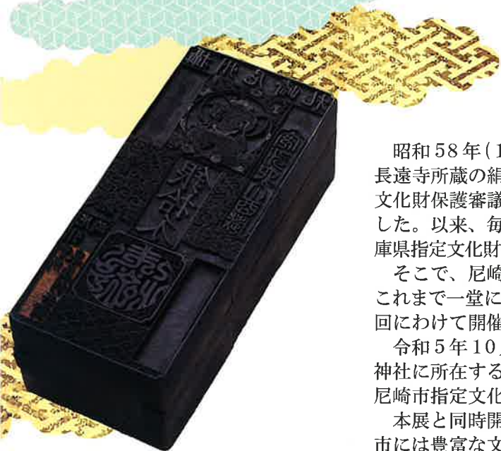
銀拾允札版木(当館所蔵)

本展と同時開催中の市内所在の国・県・市指定文化財の写真展を通して、尼崎市には豊富な文化財が現存し、長い歴史を有するまちであることを広く紹介します。なお、本展は館蔵品を公開・活用して尼崎の長い歴史や豊富な文化財を紹介する当館企画展示の第10回企画展として位置付け開催します。