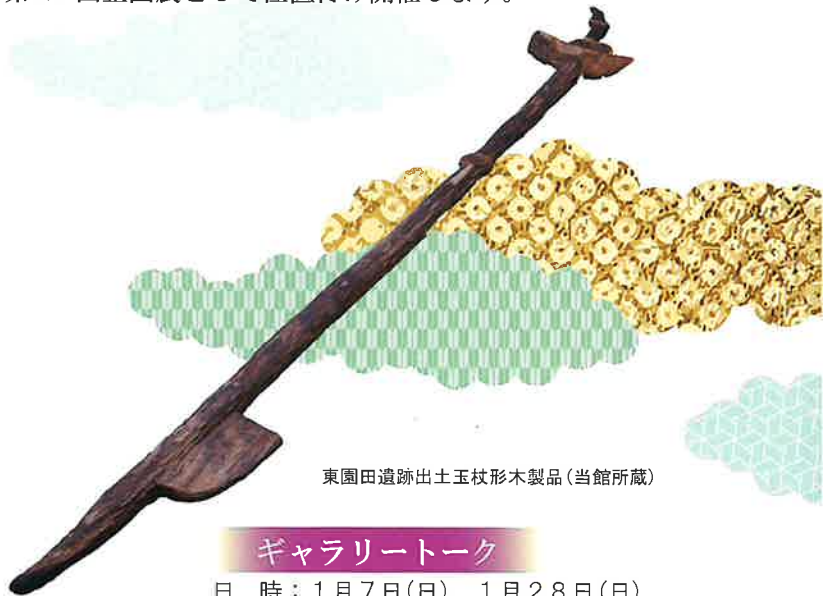
東園田遺跡出土玉杖形木製品(当館所蔵)