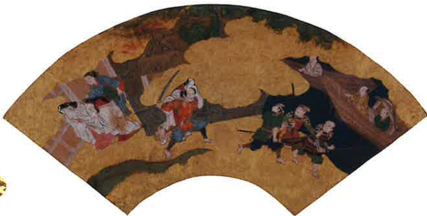
新曲図扇面(第17図)(当館所蔵)

昭和58年(1983)3月、前年に制定された尼崎市文化財保護条例に基づき、長遠寺所蔵の絹本着色涅槃図等5件の文化財が、同年に新たに設置された尼崎市文化財保護審議会での調査・審議を経て、初めて尼崎市指定文化財に指定されました。以来、毎年のように市指定文化財は増え続け、総数は59件、指定後、兵庫県指定文化財に指定された4件をのぞくと55件にまで増加しています。