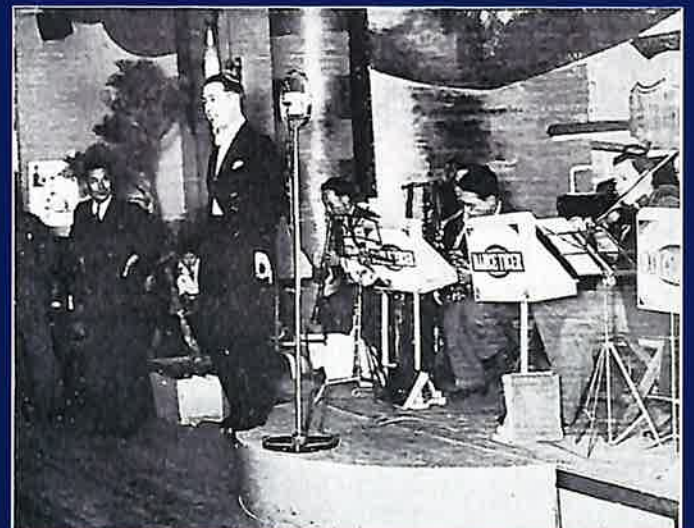
尼崎のダンスホールで演奏していた服部良一(左)と歌っていた藤山一郎(右)

所蔵者の略号は以下のとおり 所蔵A 尼崎市立歴史博物館 所蔵B 同あまがさきアーカイブズ 所蔵C 永井良和氏 所蔵D 平井英雄氏旧蔵