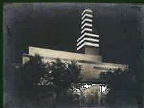
ダンスパレス夜景

昭和戦前の尼崎市内の小学校を 撮影した実写映像と、尼崎市内で平 成の時代まで使用されていた「かま ど」での炊飯を記録した映像を常時 上映し、関連する資料を展示します。