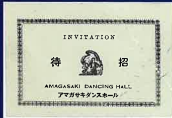
尼崎ダンスホール招待券(所蔵A)