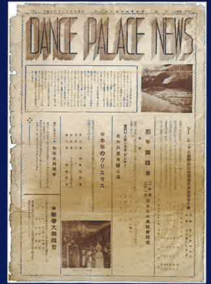
ダンスパレスニュース(所蔵C)