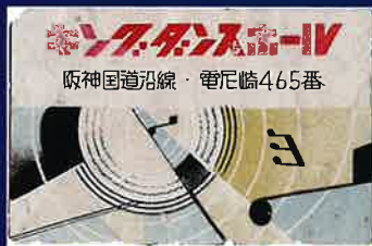
キングダンスホールマッチラベル(所蔵C)