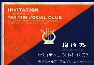
阪神社交倶楽部杭瀬ダンスホール招待券(所蔵B)