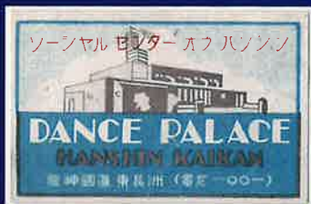
ダンスパレスマッチラベル(所蔵C)