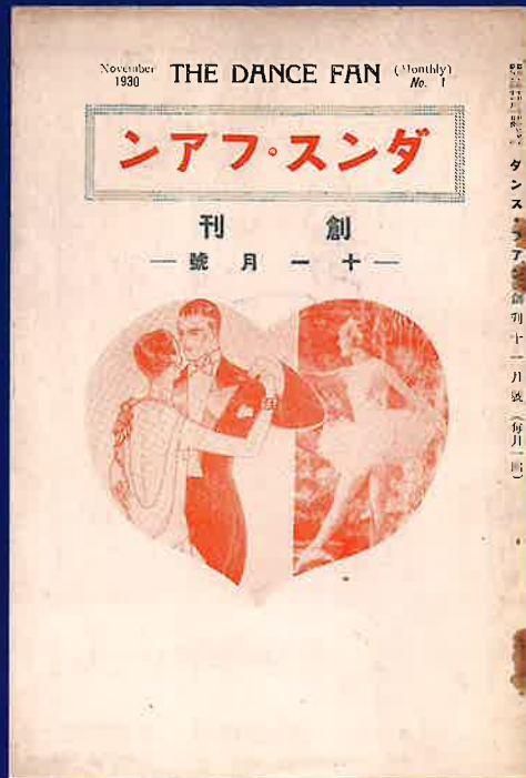
尼崎では『ダンス・ファン』と『ダンス時代』という社交ダンス雑誌が2誌発行されていました。