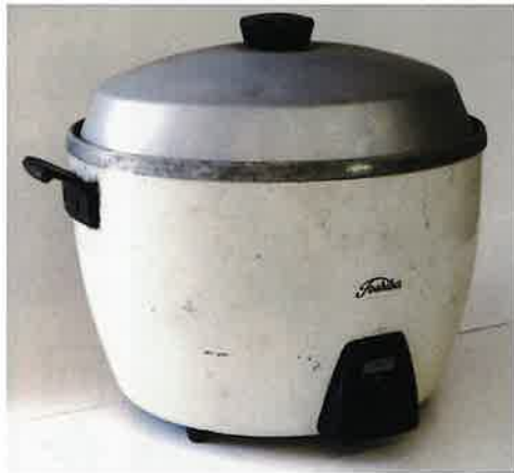
1955(昭和30)年に販売開始された世界初の自動式電気釜(炊飯器)です。1200万台以上も生産されたヒット商品です。