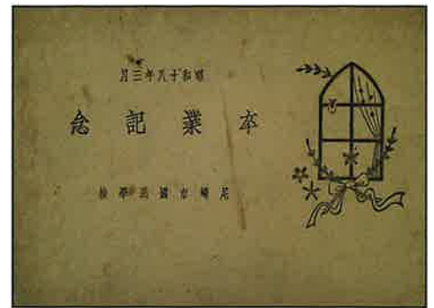
1941(昭和16)年、小学校はドイツの教育制度にならって国民学校と改称し、教育の軍国主義化が進みました。