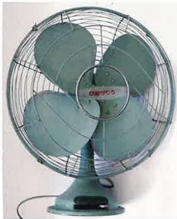
尼崎に所在した家電メーカーであるアマコー電機が製造販売した昭和30年代の扇風機です。