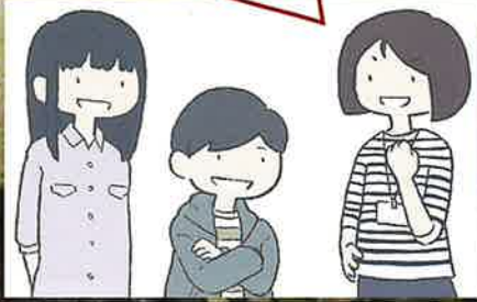
尼崎市立歴史博物館 ナビゲートキャラクター