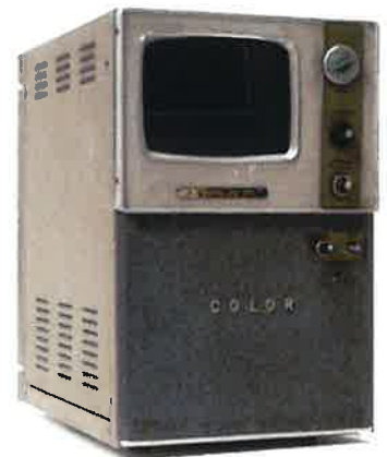
東京オリンピック前年の1963(昭和38)年に販売されたトリネスコープカラー受像機(簡易型カラーテレビ)です。

本展覧会をたくさんの小学校が団体で見学に来ます。小学校の教育課程の一環として学習に来ていますので、ご観覧のみなさまにはこの点、あらかじめご了承くださいませよう、お願い申し上げます。