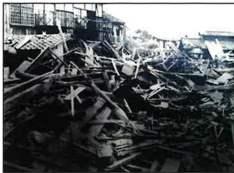
1934(昭和9)年の室戸台風により、尼崎では木造校舎に大きな被害が出ました。写真は尼崎尋常高等小学校の被災状況