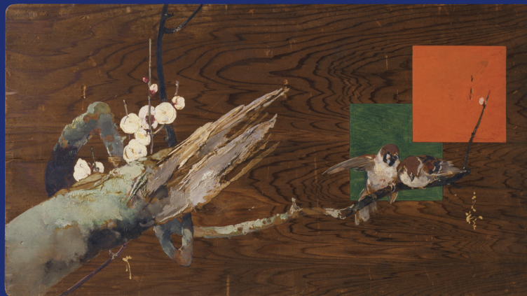
川村清雄《梅に雀》（目黒区美術館所蔵）