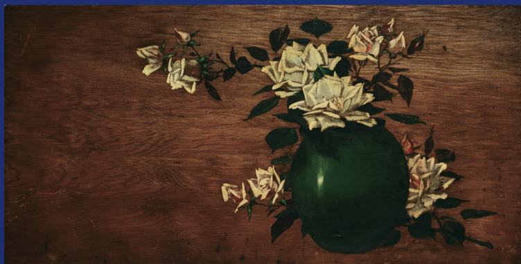
櫻井忠剛《薔薇》（当館所蔵）