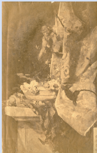
当館所蔵の櫻井忠剛自作写真帖に貼付された写真で、左は明治20年(1887)に開催された東京府工芸品共進会に櫻井忠剛が出品し受賞した《花猿》、右は明治23年(1890)に開催された第3回内国勧業博覧会に櫻井忠剛が出品し受賞した《鷲図》の写真です。いずれも川村清雄が櫻井名で出品した作品と考えられます。作品自体は未発見です。