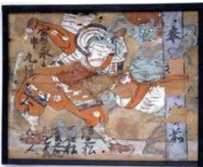
鬼の腕を切り落とす渡辺綱が描かれた絵馬（長洲天満神社絵馬のうち）