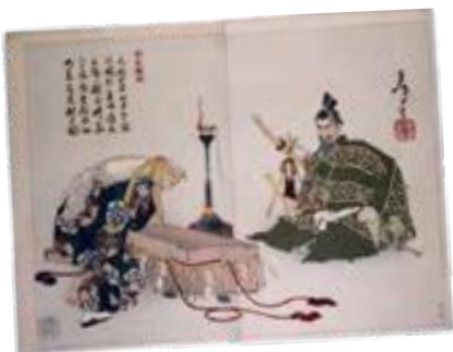
渡辺綱の家で鬼の腕を見る伯母を描いた錦絵