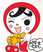
人権イメージキャラクター 人 KEN あゆみちゃん