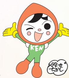
人権イメージキャラクター 人 KEN まもる君