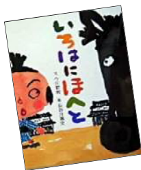
『いろはにほへと』 今江祥智/文 長谷川義史/絵 (BL 出版)