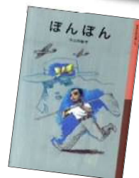
『ほんほん』 今江祥智/著 (岩波書店)