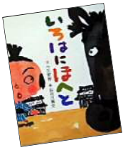
『いろはにほへと』 今江祥智/文 長谷川義史/絵 (BL 出版)

児童文学作家・翻訳家・編集者など、幅広い分野で活躍した今江祥智の生誕90年を記念して、その彩りに満ちた生涯や作品、交友関係をご紹介します。