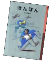
『ほんぼん』 今江祥智/著 (岩波書店)