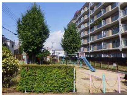
地域自主管理によって管理されている公園

令和 6 年度は 74 団体が、78 箇所の公園等（都市公園 54 箇所、子ども広場 24 箇所）で活動されています。（資料編：表 4 参照）