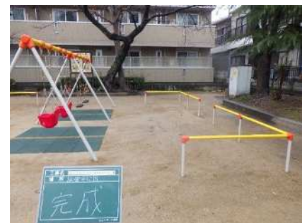
金楽寺園に設置したインクルーシブ遊具

令和 6 年度は、1 箇所の公園（金楽寺公園）で 1 基のインクルーシブ遊具を設置しました。（資料編：表 8 参照）