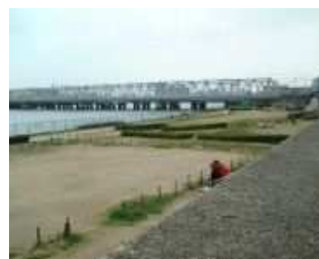
柳原緑地多目的広場