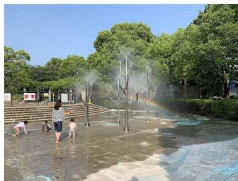
元浜緑地わんぱく池