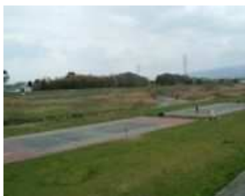
猪名川河川敷公園テニスコート