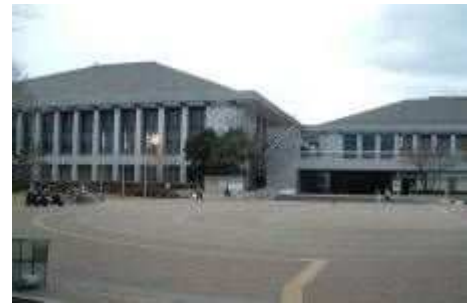
ベイコム総合体育館（記念公園）