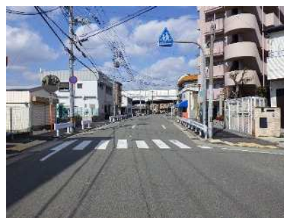
戸ノ内東園田線の街路樹適正化前（写真左：ナンキンハゼ）と適正化後（写真右）