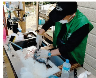
1匹ずついねいに処理

足りてる？」と声をかけてくれるほど協力的です。魚は三枚おろしにし、真空パックで冷凍し、子ども食堂などに無償で提供して喜んでいただいています。