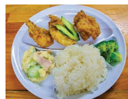
チヌのカレー風味唐揚げ