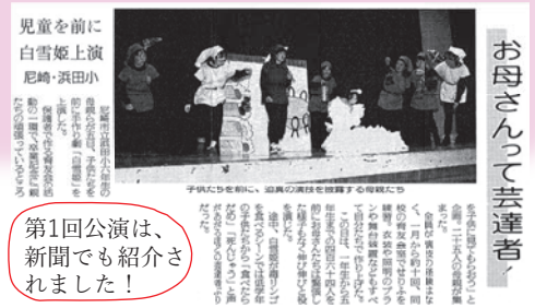
第1回公演は、新聞でも紹介されました!

創立当時の3名の団員さんは「第1回公演『白雪姫』を自分の子どもたちに見せ、今回は自分の孫たちに演技を見てもらうことになったんですよ!」と笑顔でおっしゃっていました。ここにも長く続く理由があったんですね。