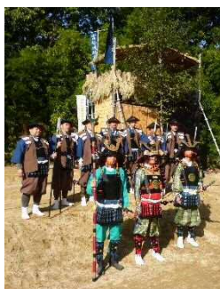
第1回富松城跡まつり