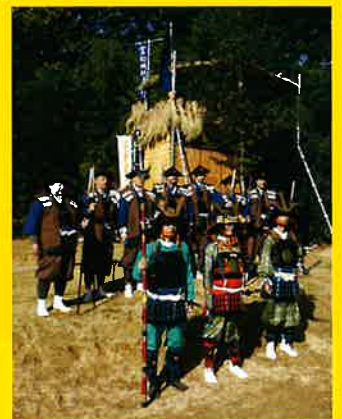
(平成28年 第1回 富松城跡まつり)

開館時間：午前9時～午後5時(入館は午後4時30分まで) 休館日：月曜 会場：歴史博物館 3階 企画展示室 入館料：無料