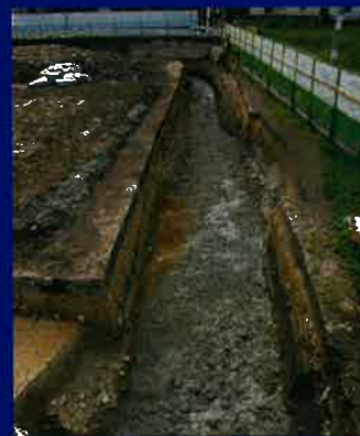
(東富松遺跡B第20次調査)