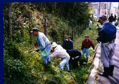
(富松城堀跡の清掃)

20年におよび富松城跡を活かしたまちづくり活動を継続して展開中の「富松城跡を活かすまちづくり委員会」と尼崎市教育委員会が協働で進めてきた富松城跡を保存し地域資産として活かす様々な取組の様子を写真パネル等で紹介します。