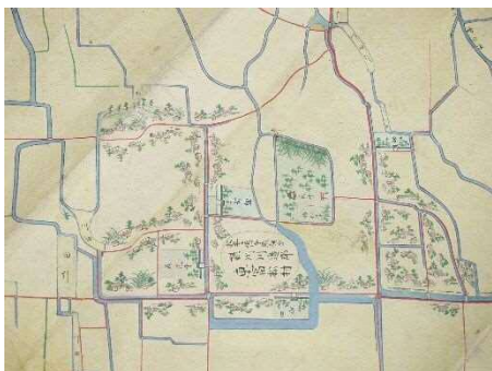
七箇村水論立会絵図 (部分)