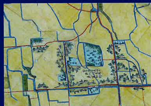
「寛政年中水論立会絵図」(部分)