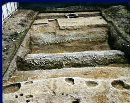
(富松城跡第3次調査)