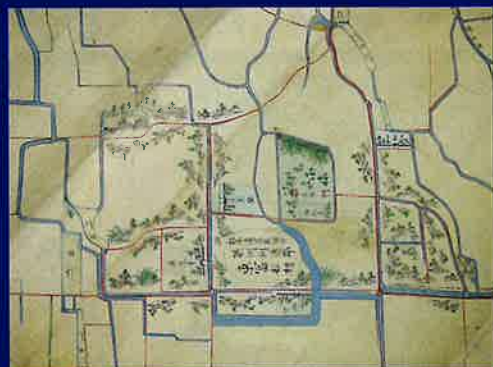
「七箇村水論立会絵図」(部分) (富松神社所蔵 東富松水利組合文書)

今回の企画展では、これまでの文献資料による調査研究と富松城跡及び周辺遺跡での発掘調査等によって得られた成果などから明らかになってきた富松城の姿を、記録や絵図などの歴史資料や出土資料によって紹介します。