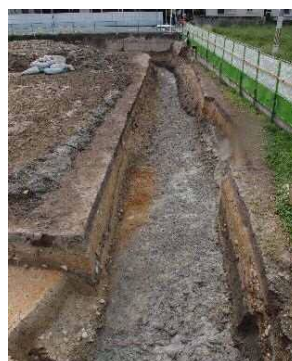
東富松遺跡B第20次調査 (堀跡)