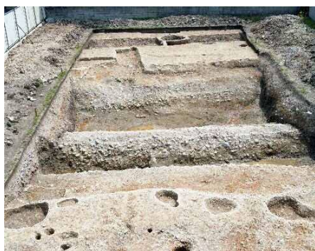
富松城跡第3次調査 (堀跡)