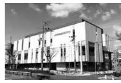
地域の皆さんの意見をたくさん反映した新プラザ

4月1日、新立花南生涯学習プラザ(栗山町2丁目25の28)がオープン! 建物はたちばな色(オレンジ)がアクセントカラーになっています。これまで地域の皆さんとどんな風に使用したいかなどを話し合っ設計しました。新プラザには、活動を気軽に見てもらえるようなガラス張りの部屋や広い交流スペース、テラスに広場、大きな吹き抜けがあるなど、多くの意見を反映した造りになっています。