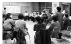
オープニングイベント 企画中!

4月1日(金)・2日(土)に開催するオープニングイベント(10ページ参照)の内容も、地域の皆さんと一緒にアイデアを出し合っ企画しました。防災かまどベンチを使ったり、広場やテラスでミニゲームやヨガをしたり、大きな窓にお絵描きしたり、子どもも大人も楽しみなから交流できる企画が盛りだくさんです。また4月3日(日)には、立花地域が舞台となったドキュメンタリー映画「まちの本屋」の上映会も。これからも、「こんなことしてみたい」「こんな場所にしてほしい」などを地域の皆さんと話し合いながら、一緒に同プラザを育てていきたいと思っています。ぜひ一度、お立ち寄りください。