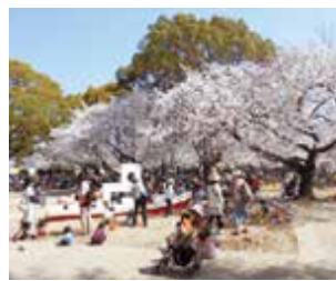
遊具広場もいつも子どもたちでいっぱい!

自動車を気にする必要がないので、小さい子どもも安心して学べるスポットとしても人気の公園です。