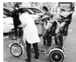
「ふたごじてんしゃ」試乗会も同時開催

交流会の開催にあたって、主催者と武庫地区の人とのつながりができればと考え、同課から武庫地区在住で高校生の双子を育てるママに応援を依頼。「自分たちが受けた恩を次に送りたい」と快く引き受けてくれ、参加していた新米ママに、子どもたちが中学・高校生になった姿について話してくれました。