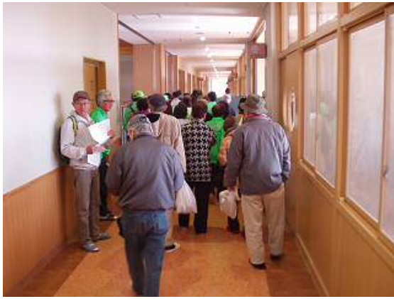
指定避難場所確認訓練