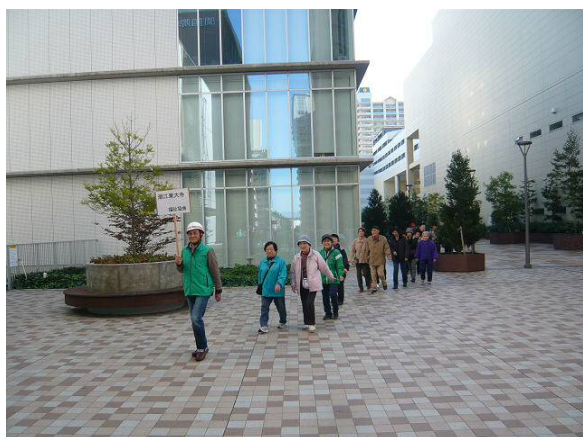
防災拠点変更訓練