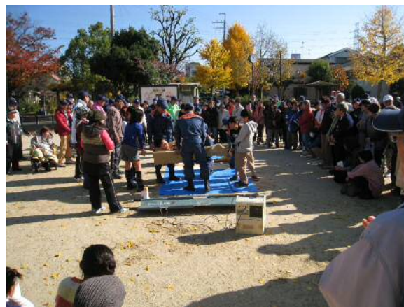
応急担架搬送訓練