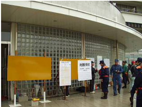
避難状況集約訓練