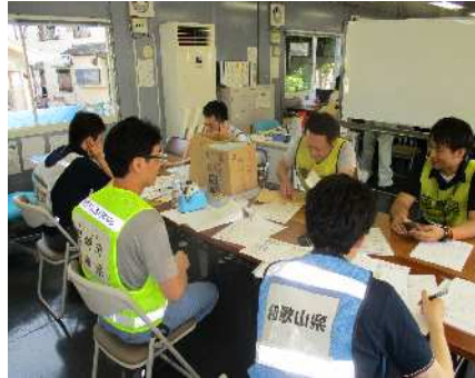
住居解体案内等の支援活動の様子