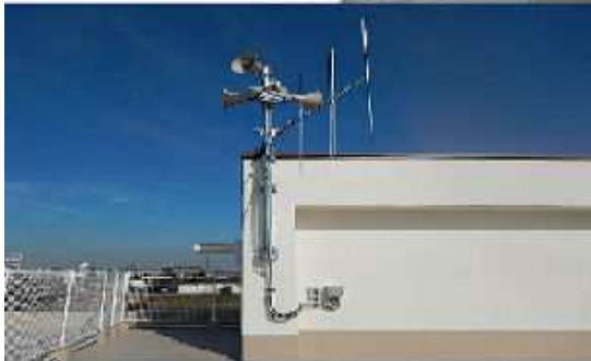
園田東小学校に設置した屋外拡声器