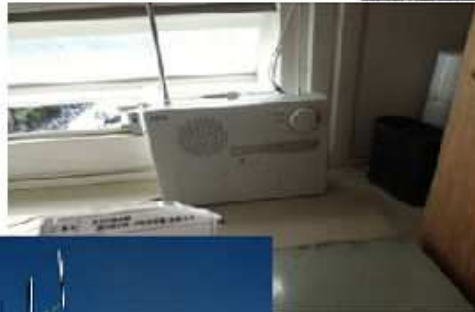
各施設に設置した 戸別受信機