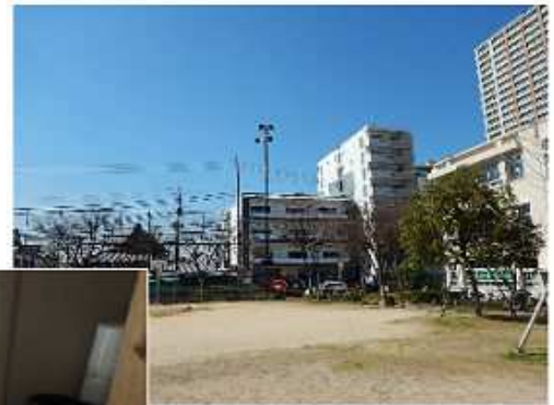
開明中公園に設置した屋外拡声器

屋外拡声器については、より多くの市民の皆様へ防災情報が迅速に伝達できるよう、今年度も引き続き拡充設置していきます。