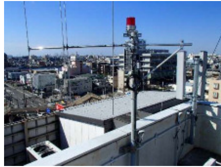
北部防災センターに設置した屋外拡声器