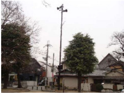
下食満公園に設置した屋外拡声器