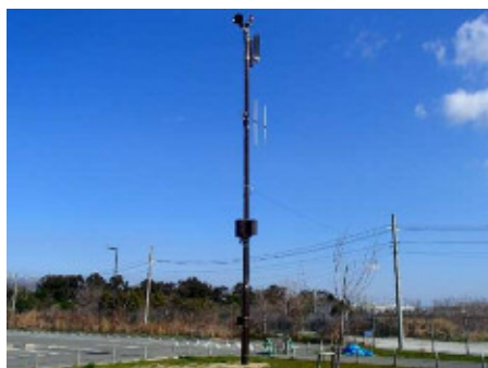
魚つり公園に設置した屋外拡声器

屋外拡声器については、市民の皆様への情報伝達手段のひとつとして防災情報が迅速に伝達できるよう、令和2年度も引き続き拡充設置していきます。