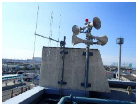
大庄中継ポンプ場に設置した屋外拡声器