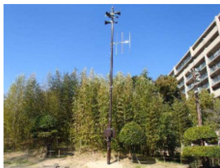
元浜緑地に設置した屋外拡声器