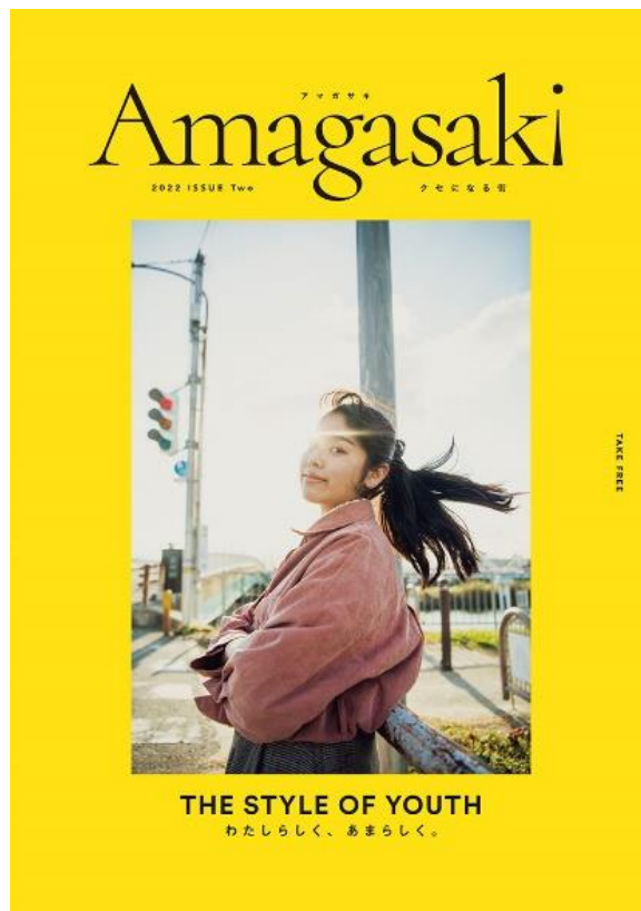
ブランドブック第2弾の表紙

第2弾は、幅広い年代にご出演いただいた前回と異なり、 尼崎市内で活動する若者の皆さんにモデルとして登場 していただき、ベルギー出身の写真家 ロブ・ワルバース氏が撮影を行いました。今を全力で生きる尼崎の若者たちの自分らしい生き方や考え方、そんな若者たちを育ててきた尼崎らしいまちの気風を感じていただけたと思います。