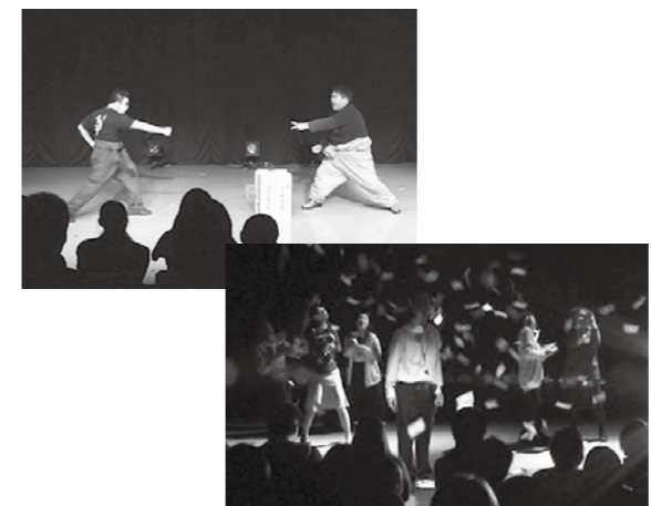
【写真上・下】同演劇祭の過去の公演の様子

◆近松門左衛門・世話物語り「曾根崎心中」 2月13日(日)午後2時から、あましんアルカイックホール・オクトで。先325人料3,500円甲電話か直接同担当。