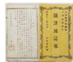
明治初期に旧尼崎藩士が作った教科書