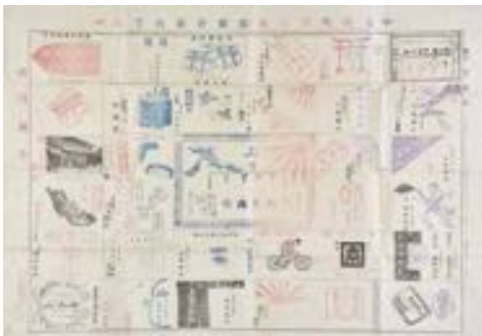
かつての尼崎町にあった商店街を紹介する双六。色使いやイラストがレトロでかわいい