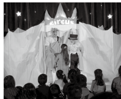
同劇場が開催した過去の公演の様子

2月23日(木)①午後2時30分から、ピッコロシアターで、人形のいろんな部分が取れたり付いたりする人形劇を②午前11時～11時30分、同シアターで、マリオネットを作るワークショップを。対①小学生以上の人②2歳児～小学2年生先①50人②15人料①親子ペア券2,500円、一般2,000円、小学～高校生1,000円②500円(マリオネットを作る人は材料費500円も。①を鑑賞する人は材料費のみ必要)甲電話で尼崎子ども劇場☎090-1973-9049(午後1時～4時30分) 休月・水・土・日曜日。