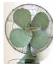
昭和30年ごろに本気で製造された扇風機

歴史博物館で、電化製品が普及し始めた頃の暮らしの道具や戦前の市内の小学校の様子を紹介する展示を。