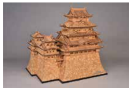
兵庫県の特産品であるマッチ棒で作られた姫路城の模型

庫県立歴史博物館の学芸員を講師に迎え「城郭巡視日記」をテーマに。定70人 月1月5日から電話かファクス(住所、氏名(ふりがな)、電話番号を書いて)で本市の歴史博物館。